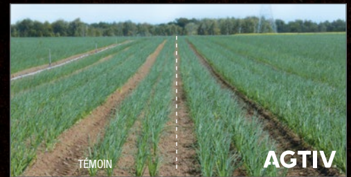
Champ comparatif d'oignon avec AGTIV® et une partie témoin. Croissance améliorée sur la droite.