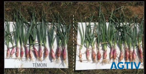
Les plants d'oignons ont plus de racines et sont plus gros avec AGTIV®.