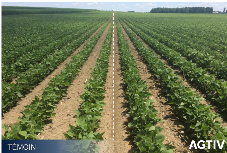
Développement des plants plus rapide, plants plus larges et fermeture accélérée des rangs avec AGTIV®.

Dispositifs expérimentaux : Essais en champs comparatifs